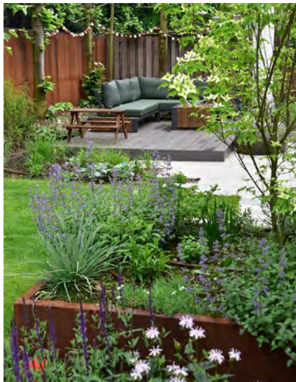
In de cortenstalen plantenbak bij het terras staat een meerstammige Cornus kousa als solitair.