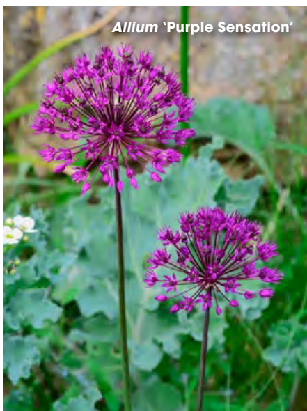
Allium 'Purple Sensation'