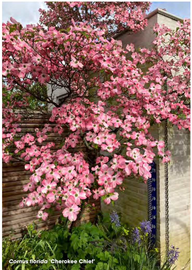
Cornus florida 'Cherokee Chief'

‘Heel veel van de beplanting stond er natuurlijk al. Daar ben ik helemaal trots op.’