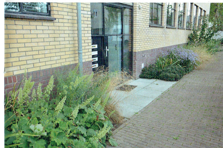
Aan het einde van de zomer, begin van de herfst vallen aan de schaduwzijde de witte toortsen van Heuchera villosa var. macrorrhiza op. Ook bloeit de blauwe Aster macrophyllus 'Twilight' al volop. Deschampsia cespitosa 'Schotland' is het enige gras dat Stegers in de schaduw heeft toegepast.