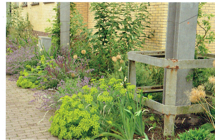
De stalen corridors van de leidingstraten herinneren nog aan de industriële geschiedenis van Strijp R. Langs de twee staanders heeft Stegers Wisteria sinensis 'Prolific' aangeplant. In juli bloeien de Euphorbia seguieriana subsp. niciciana nog volop, evenals de Salvia nemorosa 'Caradonna' en de S. verticillata 'Purple Rain'. De zaadhoofden van Allium 'Purple Rain' zijn ook nog decoratief.