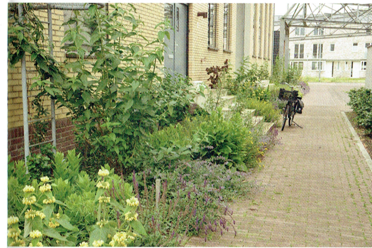
Zomers bloeien aan de zonzijde onder meer Phlomis russeliana , Salvia verticillata 'Purple Rain', Linaria purpurea , Achillea 'Walther Funcke' en Nepeta 'Novanepjun' Junior Walker.