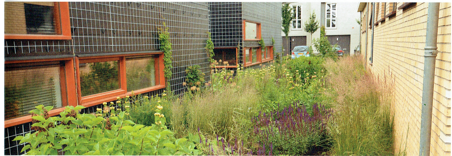
Het 5 m brede tussenstuk is geheel beplant. De ramen van de nieuwbouwwoningen bieden zicht op de vegetatie, evenals de dakterrassen van het voormalige pompgebouw. De bewoners onderhouden de tuin zelf. Hovenier Van der Hulst komt aan het einde van de winter langs om de vaste planten terug te snoeien. Twee keer per jaar bemest het bedrijf de beplanting.