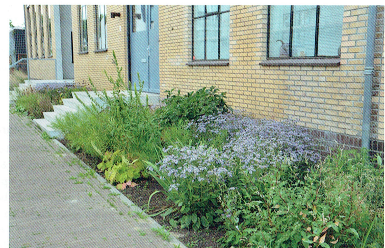
De gele verblendsteen, de hoge ramen en het opgetilde maaiveld: ontwerper Piet Hein Eek zag genoeg mogelijkheden het voormalige pompgebouw van Strijp R te transformeren. In de Philips-tijd stond het vol met compressors die perslucht fabriceerden. Via de leidingstraten werd die perslucht verspreid over Strijp R. Nu bestaat het gebouw uit tien appartementen met werkruimtes.